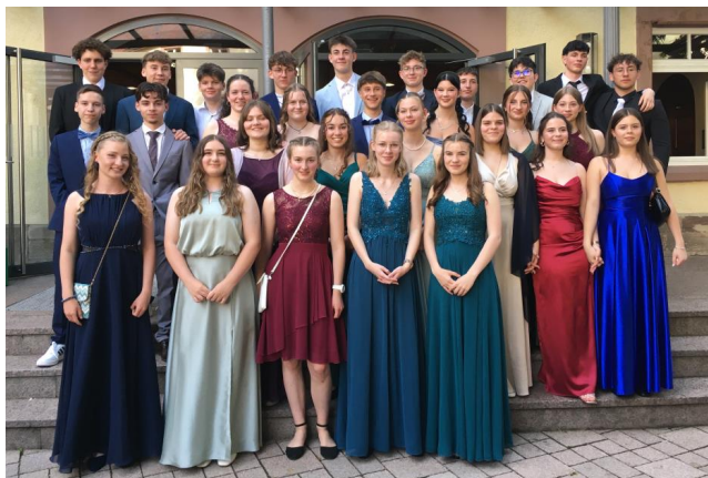
Unsere Realschulabschlussschülerinnen und -schüler 2024

Zwei Mal im Jahr führen wir eine Profilwoche durch mit den Themen „Lernen lernen“, „Technisches Arbeiten“, Sozialpraktikum „Compassion“, Assessment-Center „Profil AC“, Berufspraktikum „BORS“ sowie „Fit für die Prüfung“.