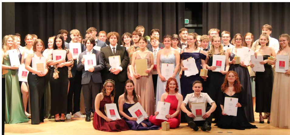
Unsere Abiturientinnen und Abiturienten des Jahrgangs 2024

In der Kursstufe (Klasse 12 und 13) können unsere Schülerinnen und Schüler in Kooperation mit den Villingen Gymnasien am Romäusring und am Hoptbühl aus einer umfassenden Auswahl an Kursen wählen.